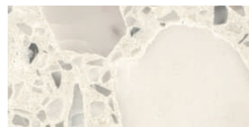
lucido / polished / poliert